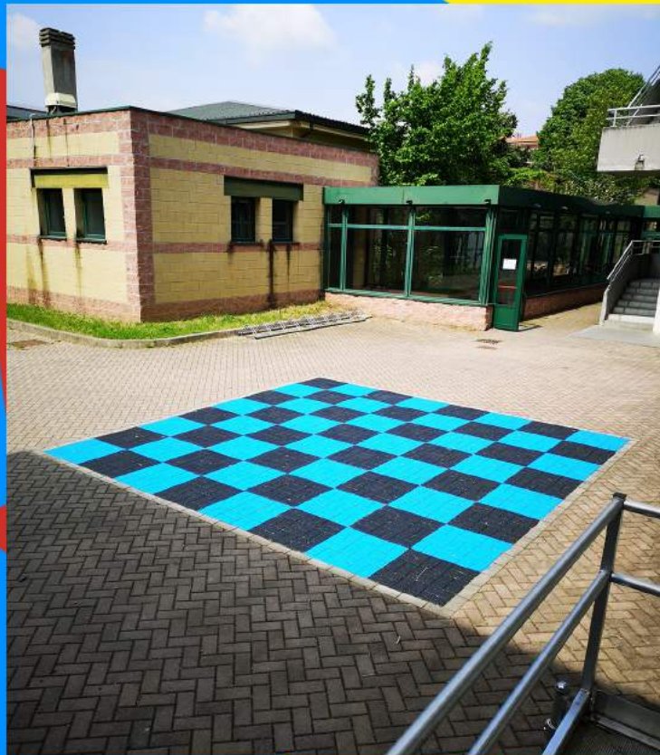
La scacchiera realizzata nel cortile