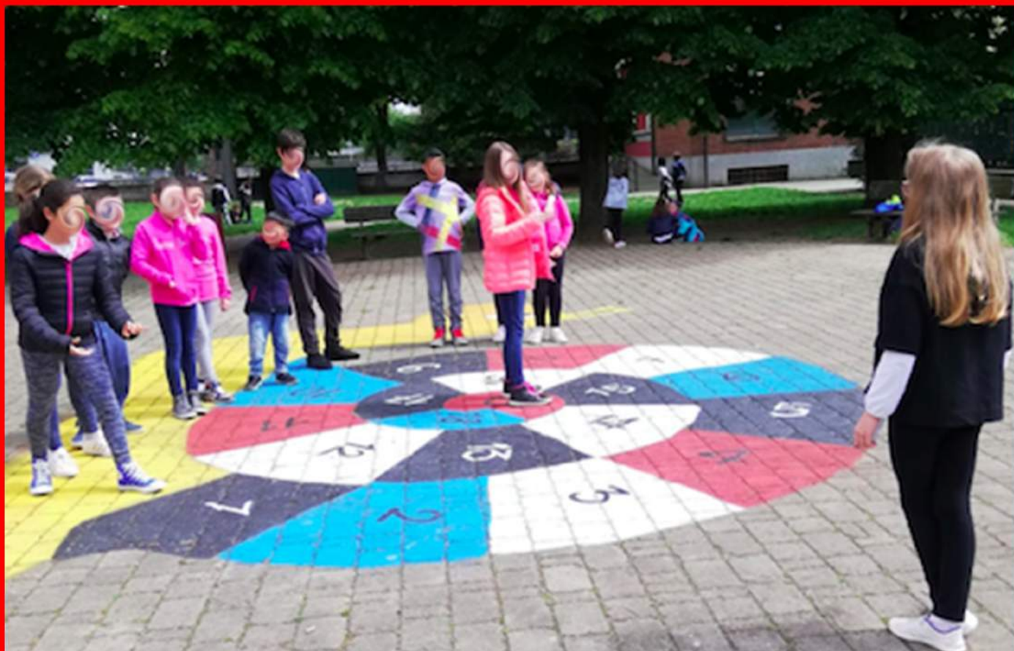
Alcuni bambini della scuola Quintino Di Vona a Cassano d'Adda, giocano con uno dei lavori ultimati.

Oltre a tutto questo, il progetto offre una riqualificazione della scuola a livello estetico con colori accesi che donino vivacità alla struttura.