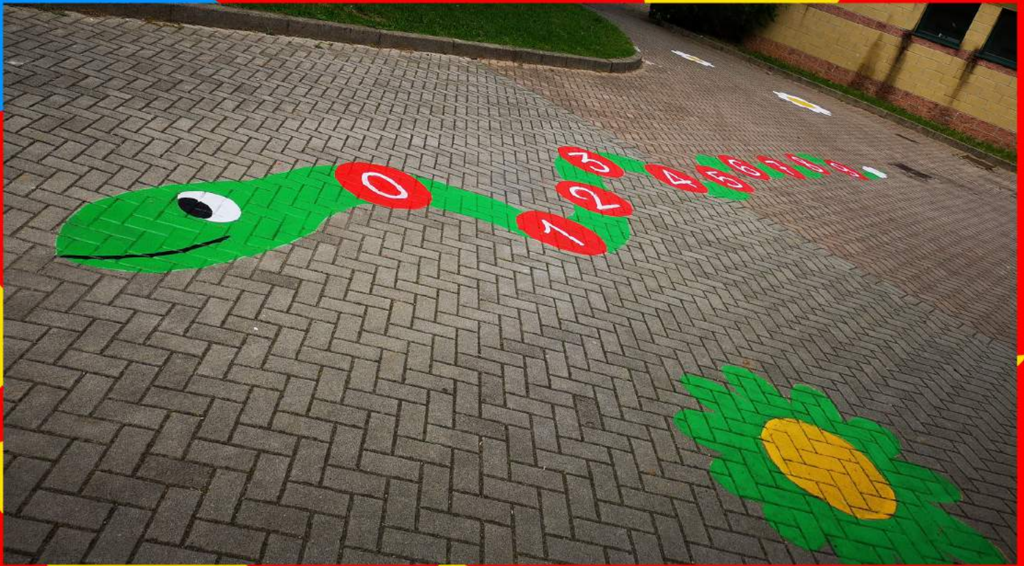
Sopra: il Serpente dei Numeri e qualche fiore decorativo sparso qua e là per il cortile.