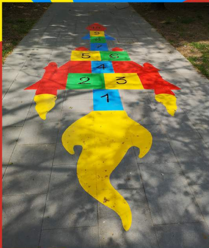
Il gioco MONDO o CAMPANA personalizzato con un missile spaziale